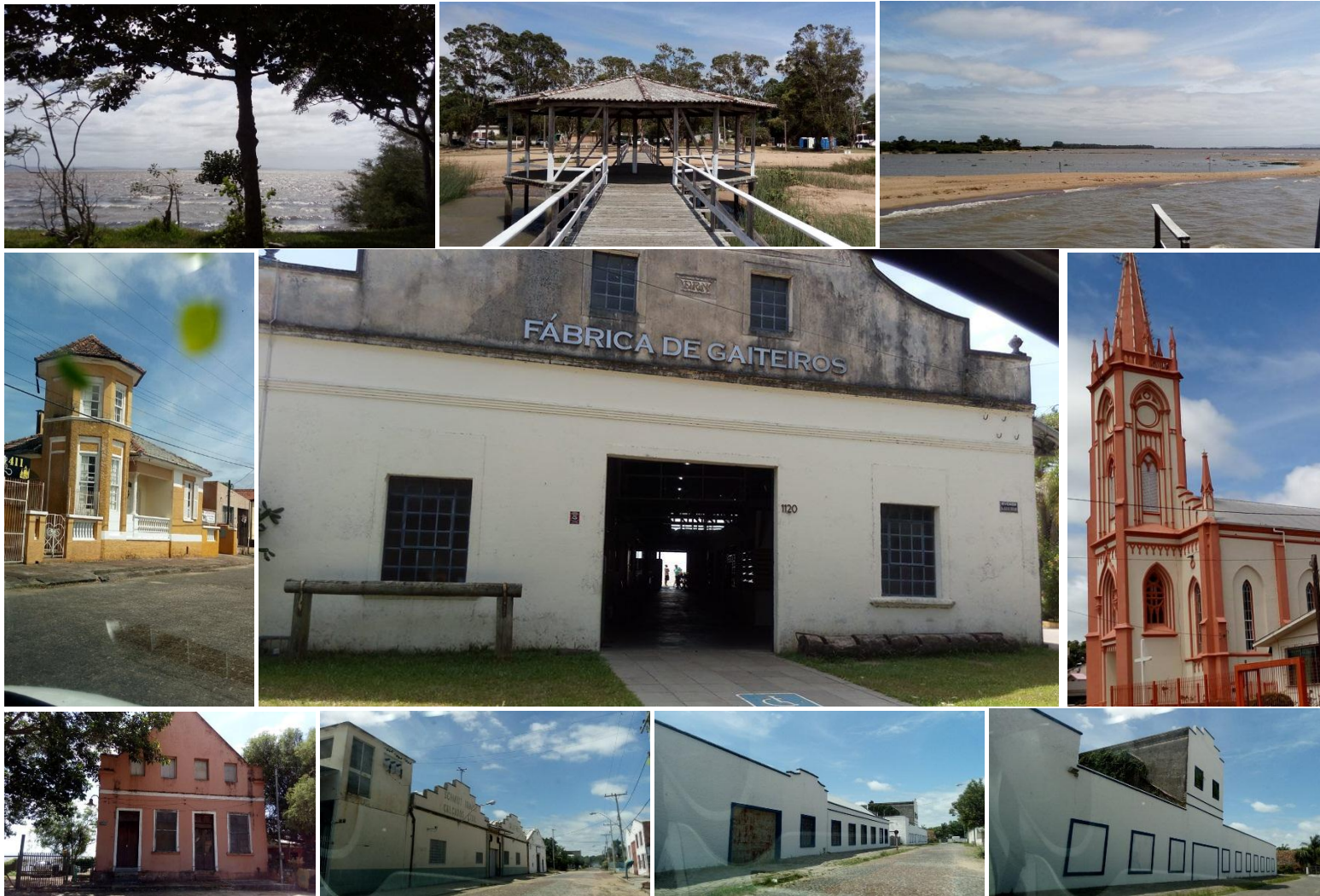
Um pulinho (turístico e cultural) à Barra do Ribeiro RS para o almoço de sábado – A 56 quilômetros de Porto Alegre pela BR 116 e RS 709, o povoamento desta região iniciou-se em 1800, com a chegada dos açorianos, predominando o elemento português na formação da população. Em 1874, reinicia-se no RS a corrente migratória que iria atrair colônias de poloneses, alemães e italianos, que tivera também, grande influência na formação étnica da população. O Arroio Ribeiro ao desembocar no 'Guaíba' no verão, forma uma coroa de areia de um lado ao outro das margens, formando assim a 'Barra do Ribeiro'. Pesca amadora (pintado, jundiá, traíra entre outros). Teve origem na charqueada de Antônio Alves Guima rães, instalada na sesmaria que lhe fora concedida por Dom Luis de Vasconcelos e Souza, em 1780. Sua denominação de Charqueada foi substituída pela de Barra, mais tarde para Barra do Ribeiro. Fonte: IBGE - Prefeitura Municipal – Wikipédia - Fotos: Elaine Camargo.