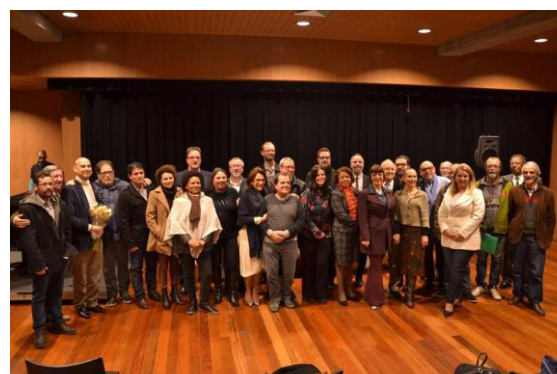
Posse dos novos Conselheiros de Cultura do Estado, e também dos reeleitos, pelas instituições não governamentais da sociedade civil.