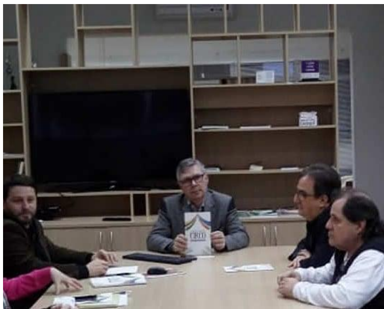
Reunião com o Secretário de Educação do Estado sobre a necessidade de facilitar a inserção dos filhos dos circenses e dos integrantes dos parques de diversões, nas escolas do estado.