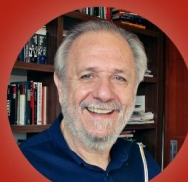
Mediação: Miguel Rossetto